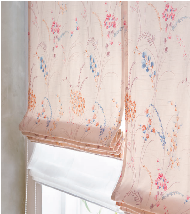
ブレースシェード・ダブルシェード仕様 前1197 後1650