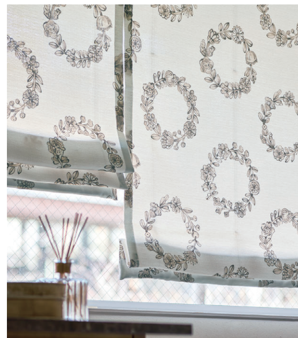
ブレースシェード1195