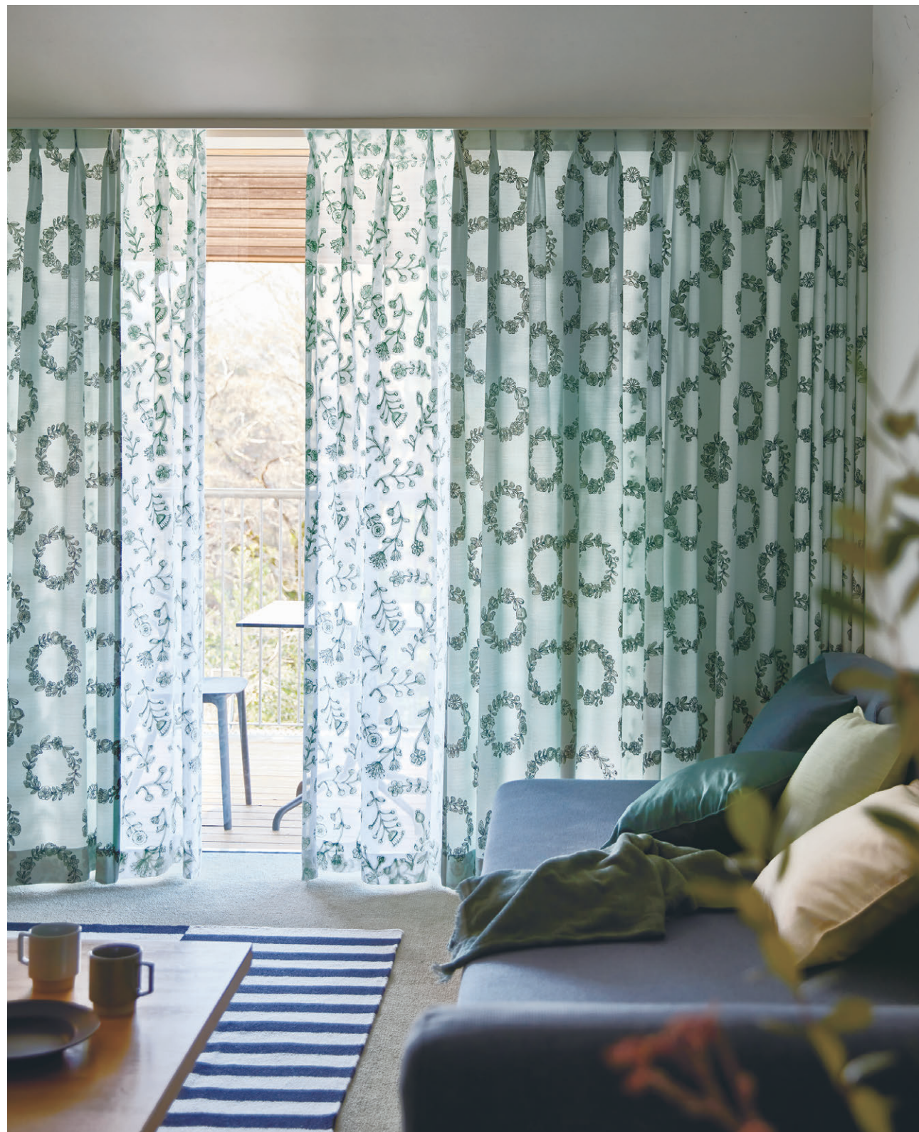
ドレープ1196 レース1562 クッション[手前から]1265 1280 1282 1276