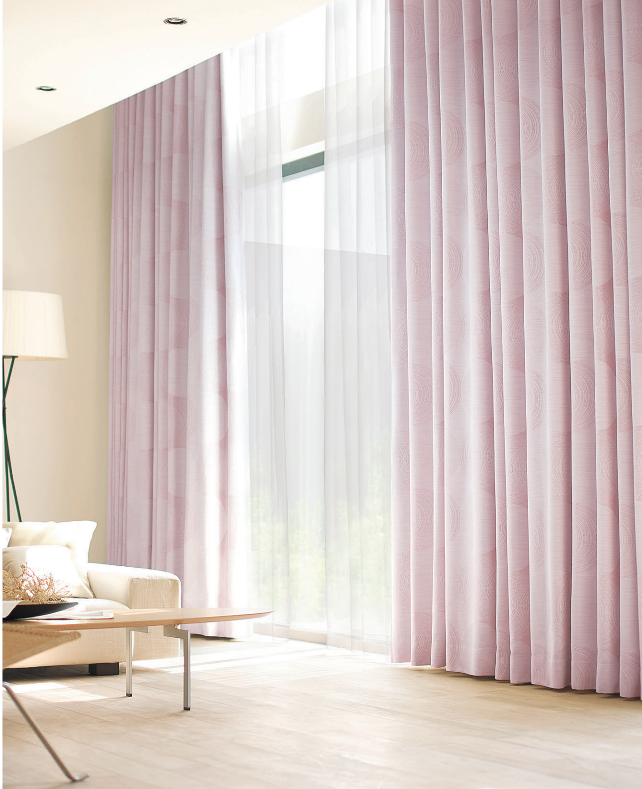
ドレープ1180 レース1606 クッション[手前から]1263 1264