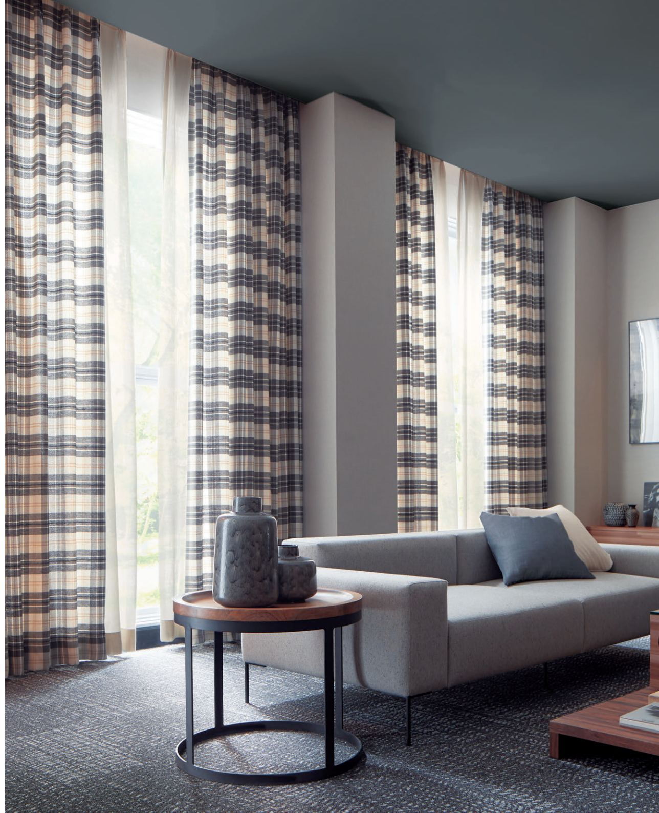
ドレープ1171 レース1613 クッション[左から]1289 1325