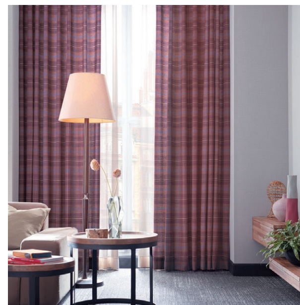
ドレープ1173 レース1613 クッション1336