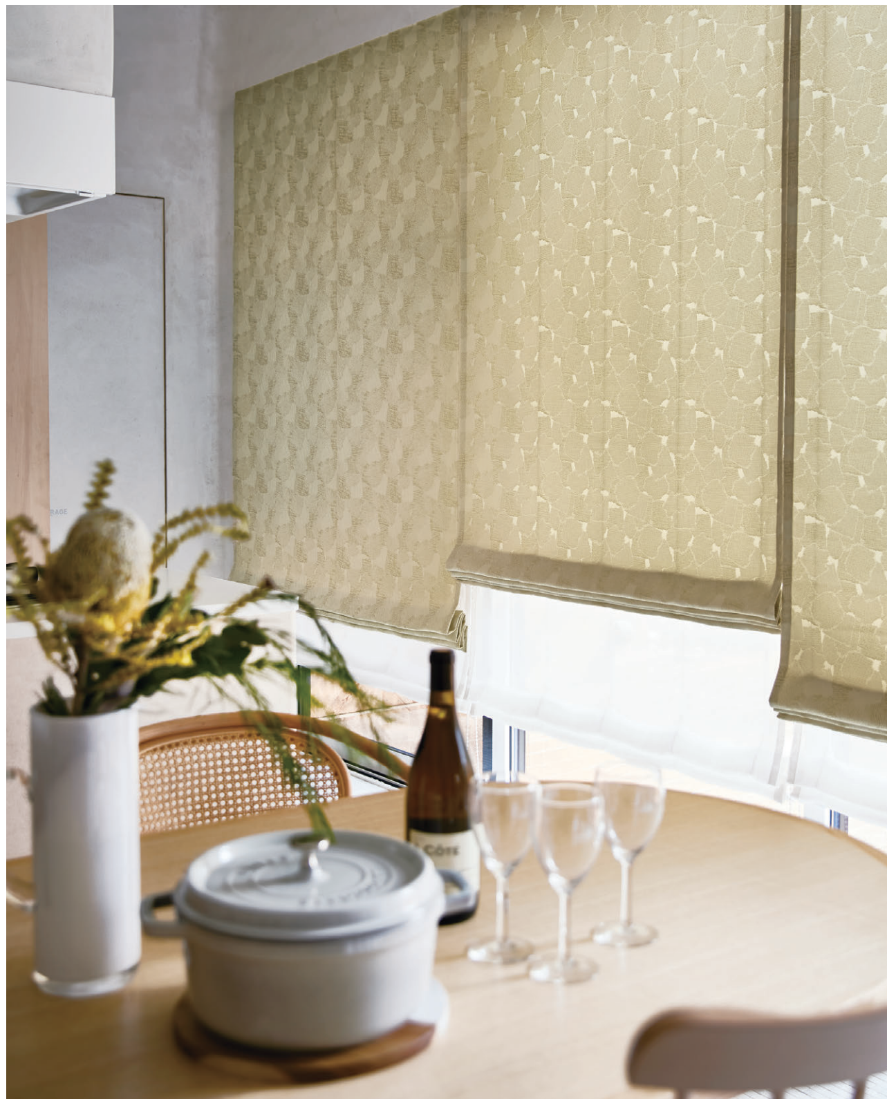
ブレンシェード・ダブルシェード仕様 前1166 後1588