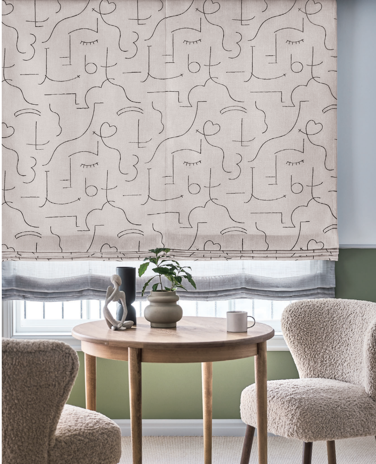
ブレースェード・ダブルシェード仕様 前1161 後1584