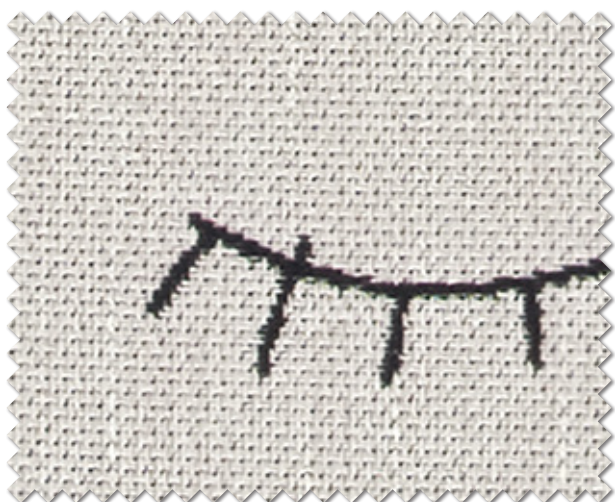
ML-1161 NEW P.7掲載