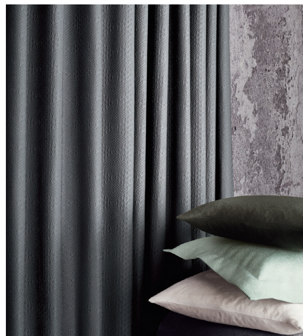
ドレープ1145 クッション[上から]1283 1351 1110