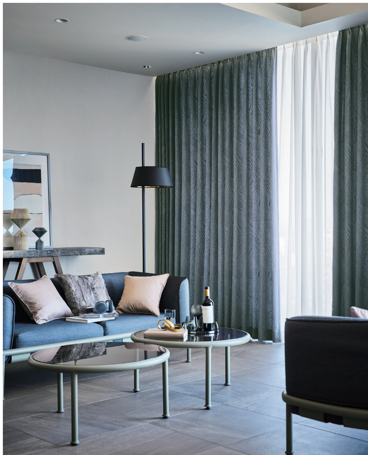
ドレープ1126 レース1645 クッション[左から]1270 1266