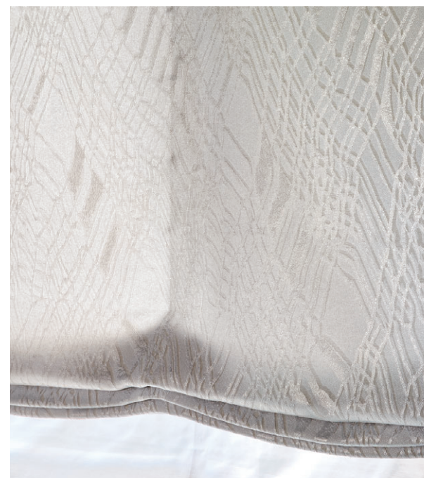
ブレンシェード・ダブルシェード仕様 前1125 後1618