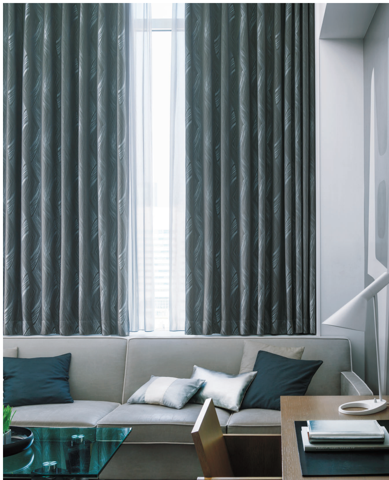
ドレープ1122 レース1594 クッション[左から]1276 1273 / 1264(参考商品) 1276