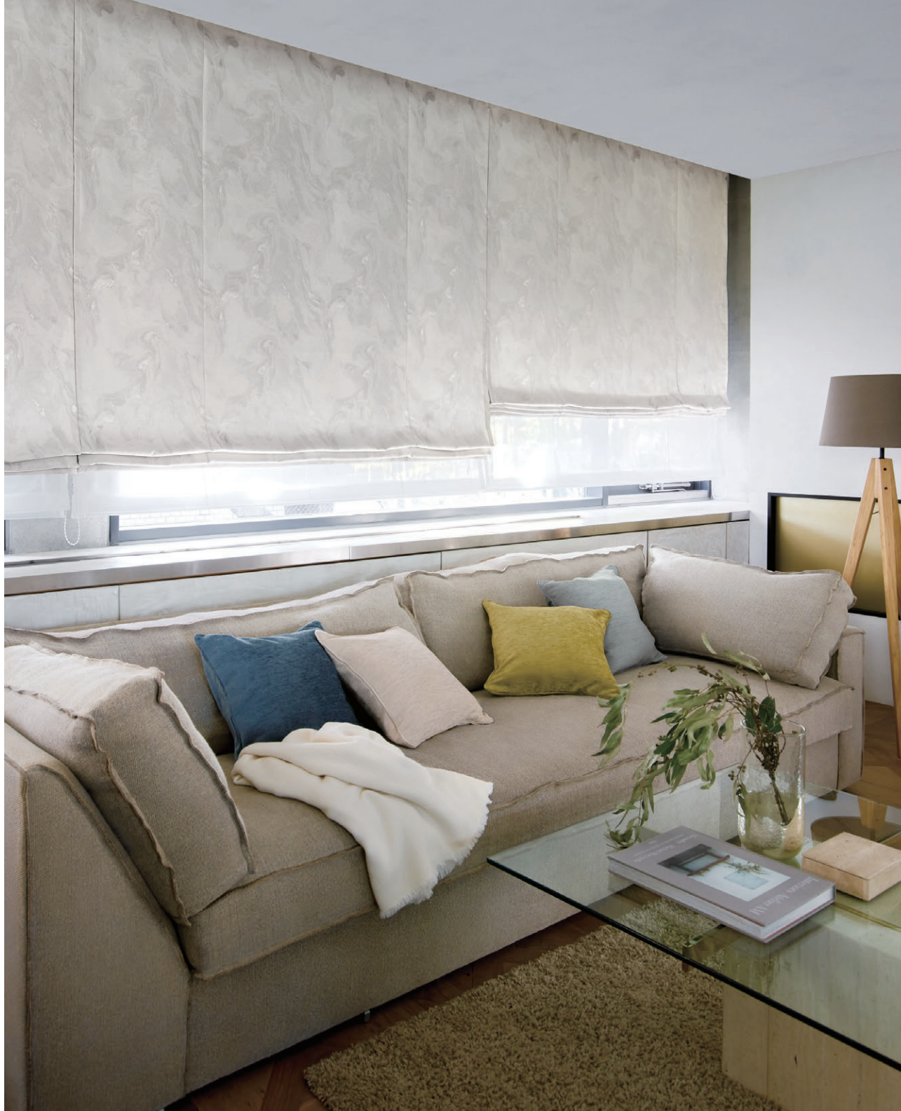
ブレースード・ダブルブレースード仕様 前1110 後1645 クッション[左から]1262 1257 1259 1260