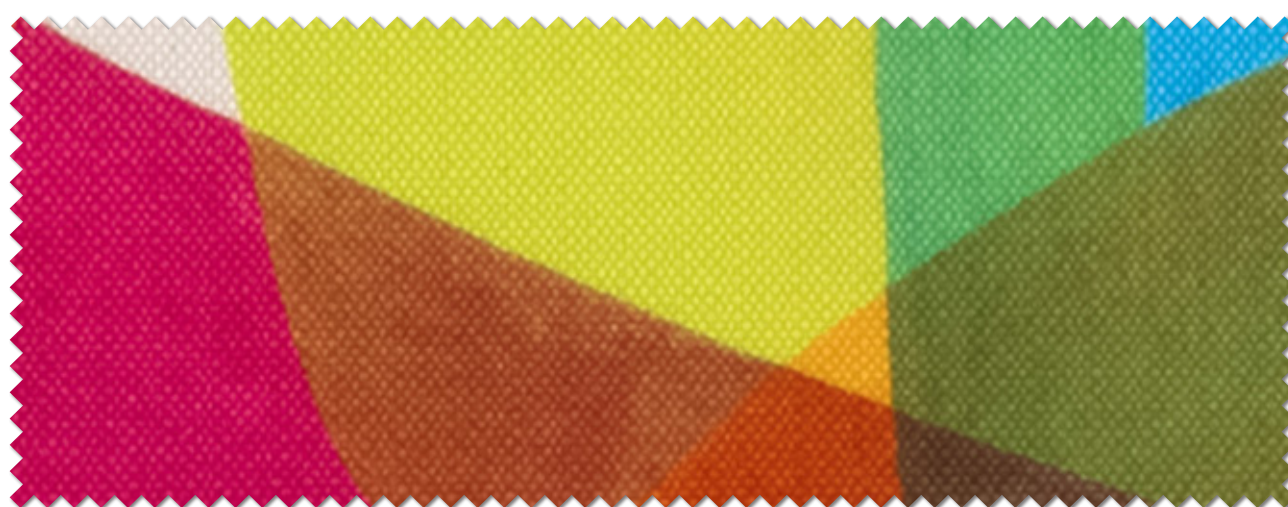
ML-1105 NEW P.6 掲載