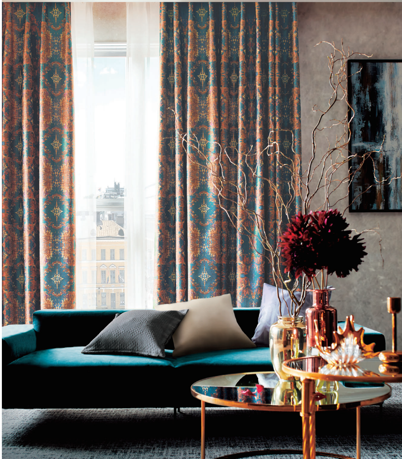
ドレープ1070 レース1646 クッション[左から]1145 1508 1424