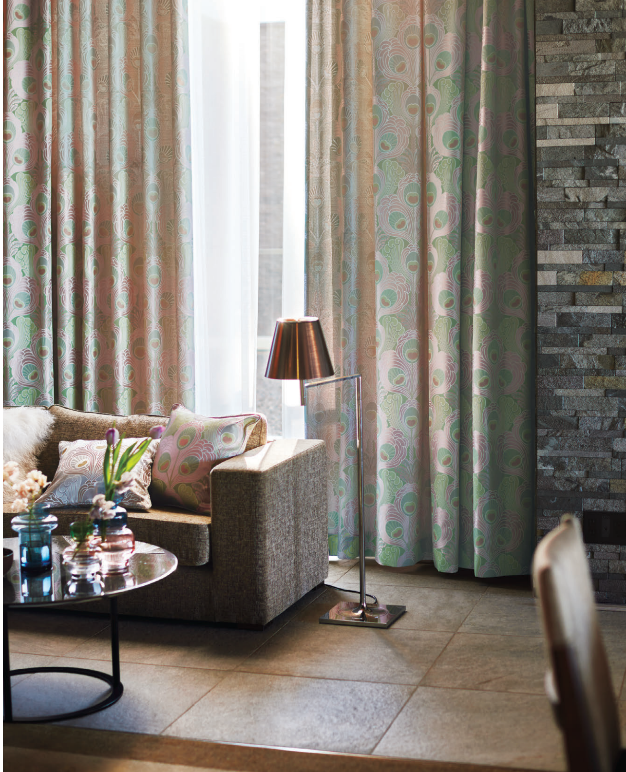
ドレープ1069 レース1659 クッション[左から]1068 1069