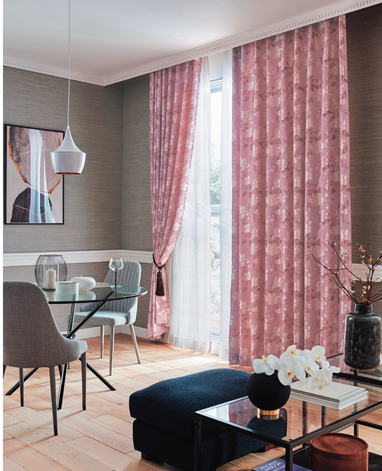
ドレープI063 レースI606 タッセルEF-594 (04)