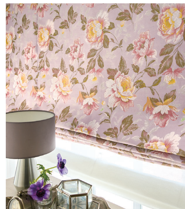
ブレンシェード・ダブルシェード仕様 前1059 後1650