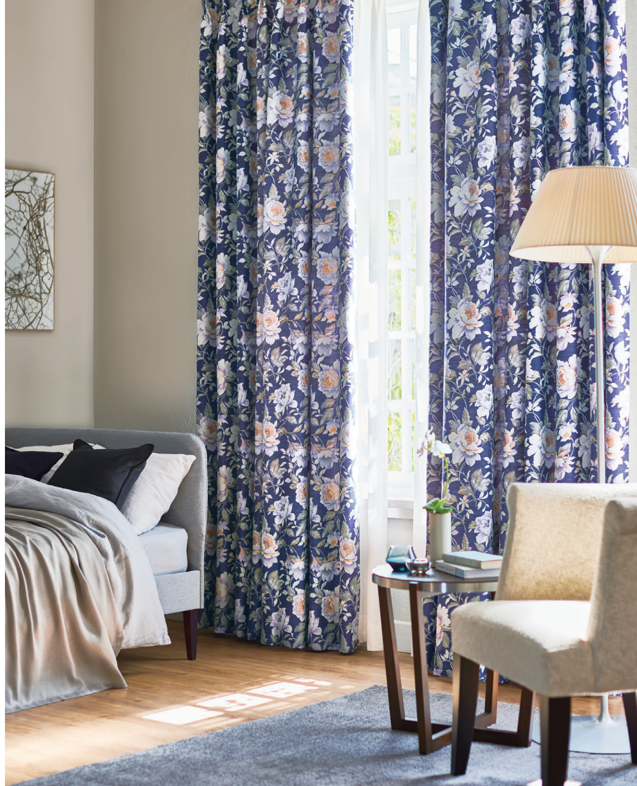
ドレープ1060 レース1649 クッション1506