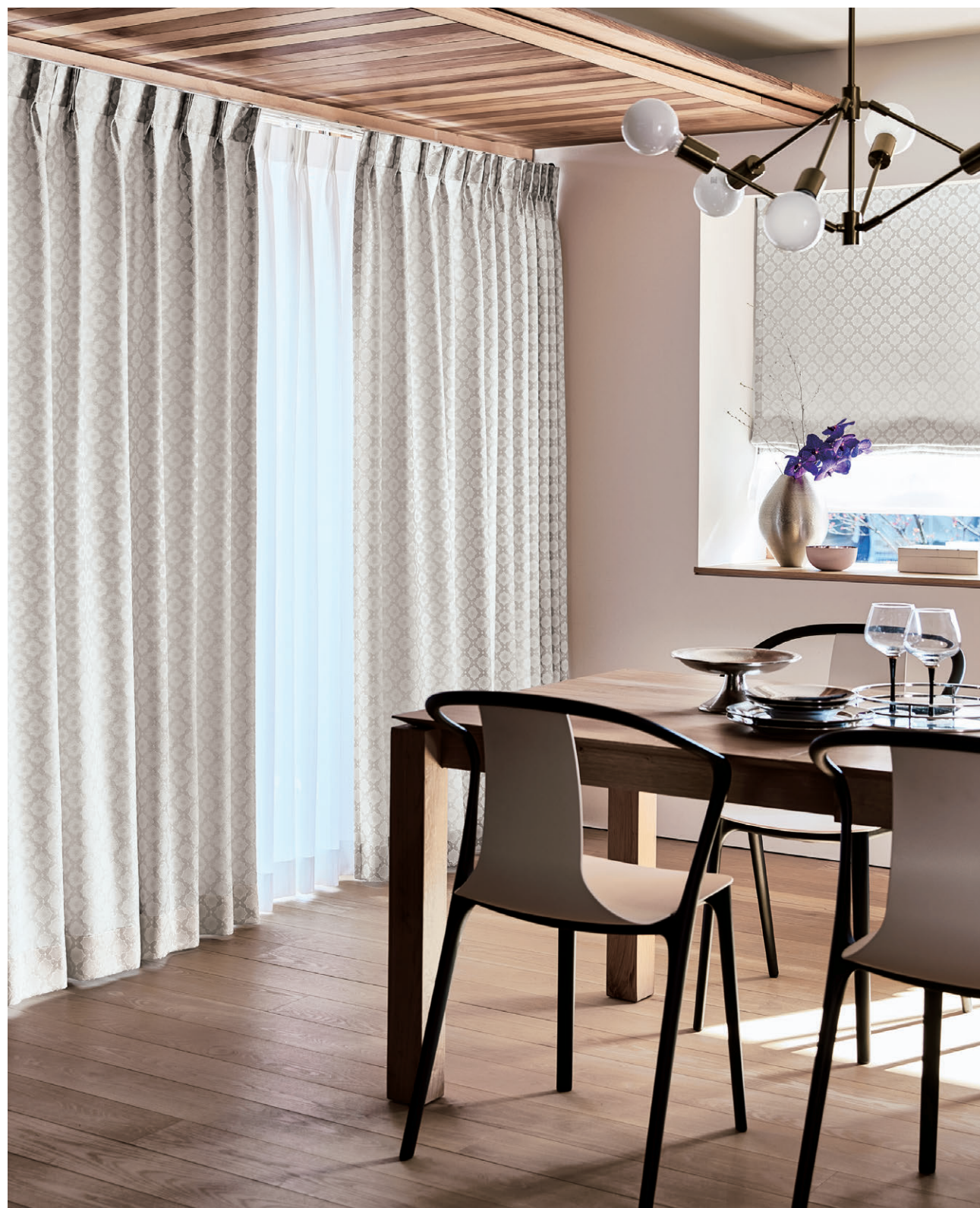
ドレープ1055 レース1642 プレースシェード・ダブルシェード仕様 前1055 後1642