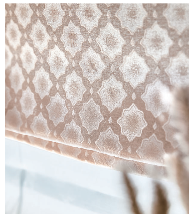
ブレースシェード・ダブルシェード仕様 前1056 後1589