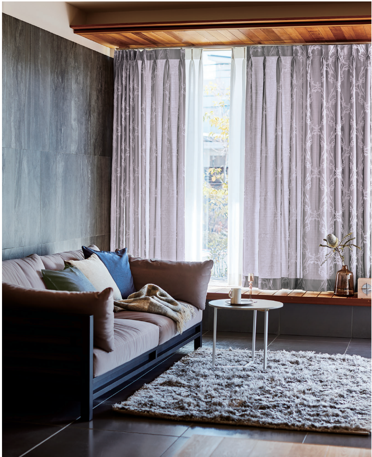
ドレープ1052 レース1618 クッション[左から]1276 1272 1288