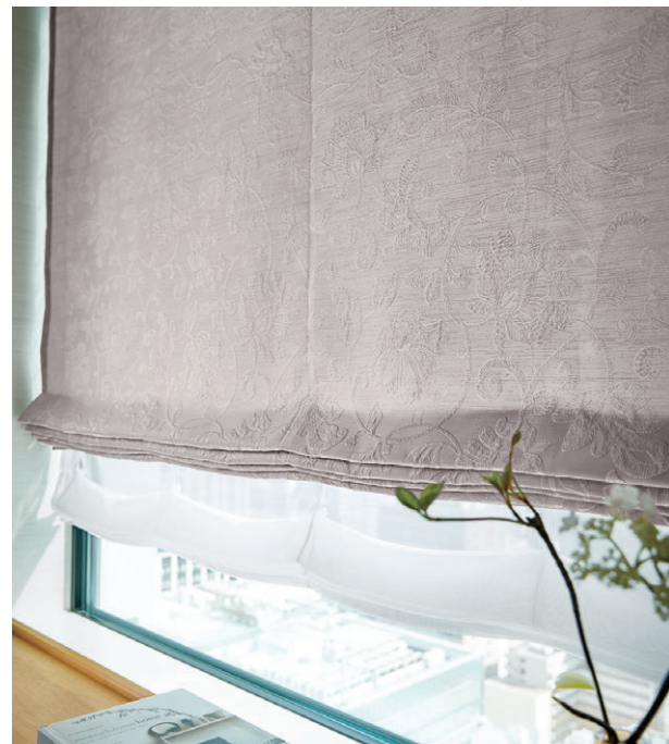
ブレインシェード・ダブルシェード仕様 前1049 後1629