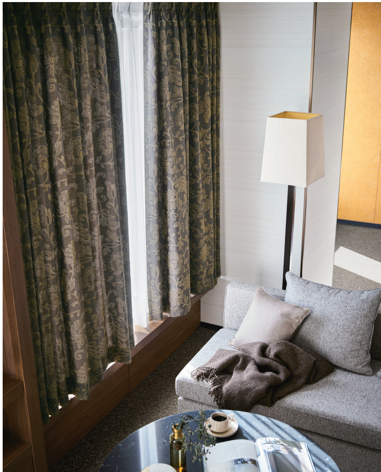
ドレープ1050 レース1629 クッション1270