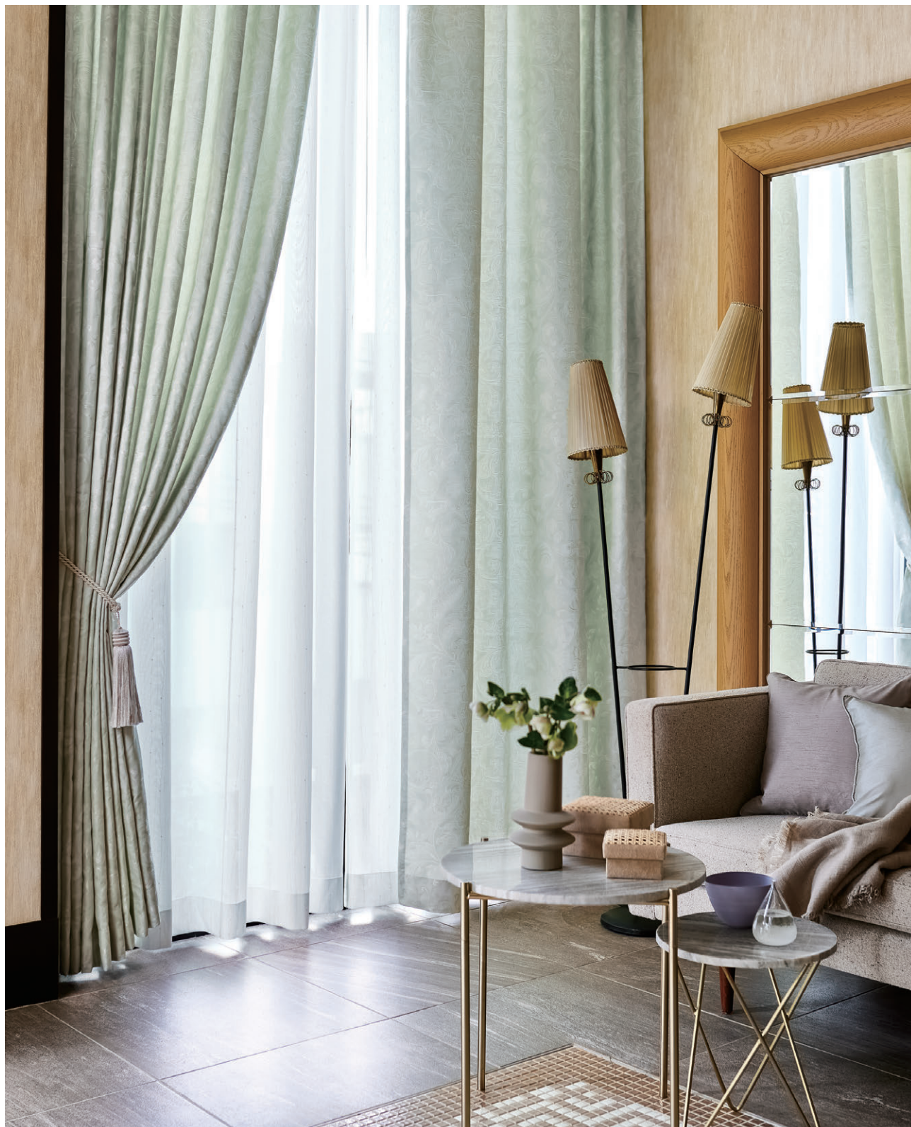
ドレープ1048 レース1636 タッセルEF-594 (01) クッション[左から]1274 1273