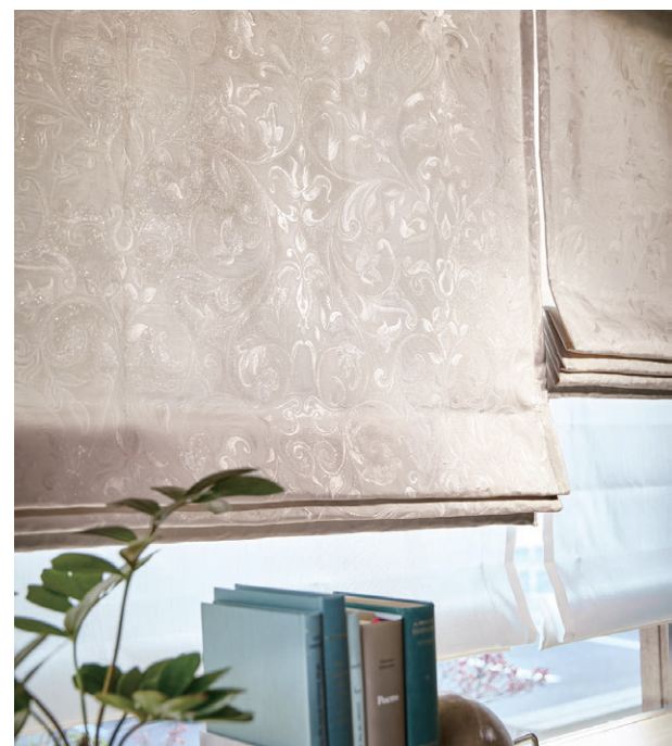
ブレンシェード・ダブルシェード仕様 前1047 後1644

●風通組織(二重織)のため、ヒダの谷間に若干シワがでる場合があります。生地の特性として、ご了承ください。