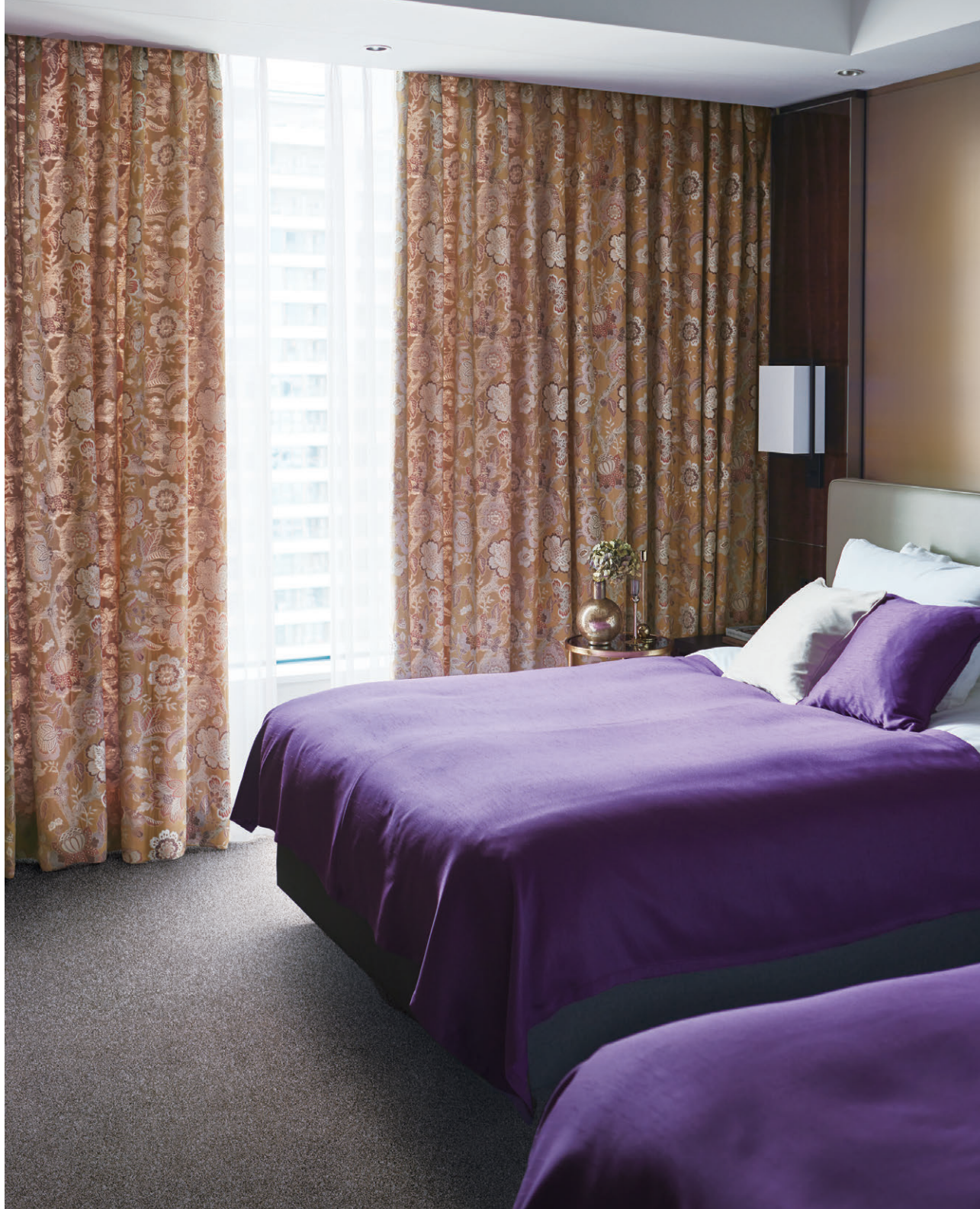
ドレープ1045 レース1632 クッション[左から]1499 1504 ベッドspread1504