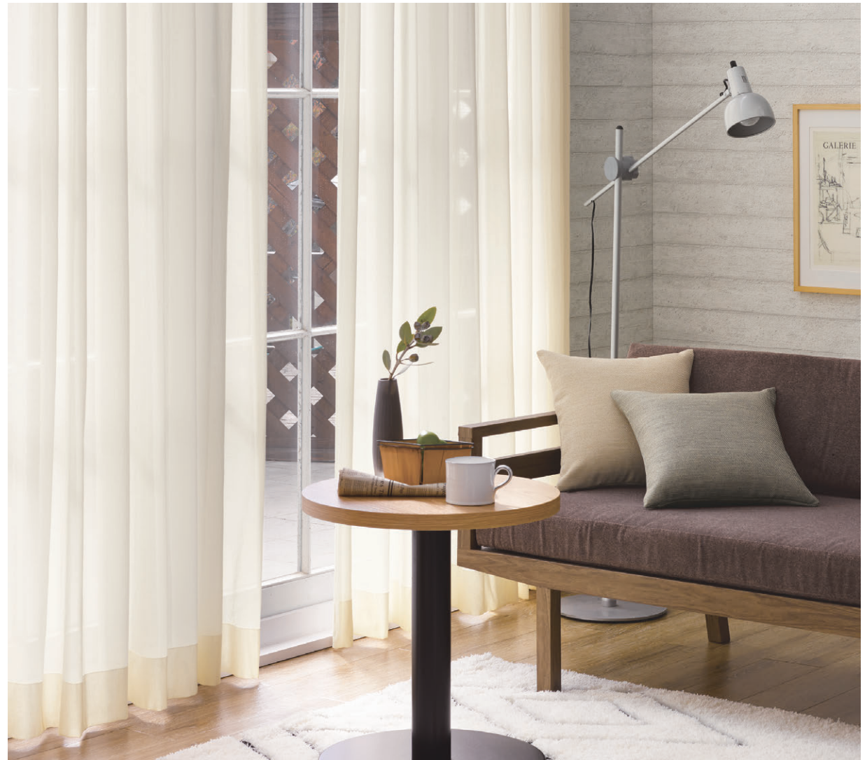
[レース] TKF30704 スタンダード縫製 [クッション](左) TKF30388 (右) TKF30390 CS-P [ラグ] TOR4308