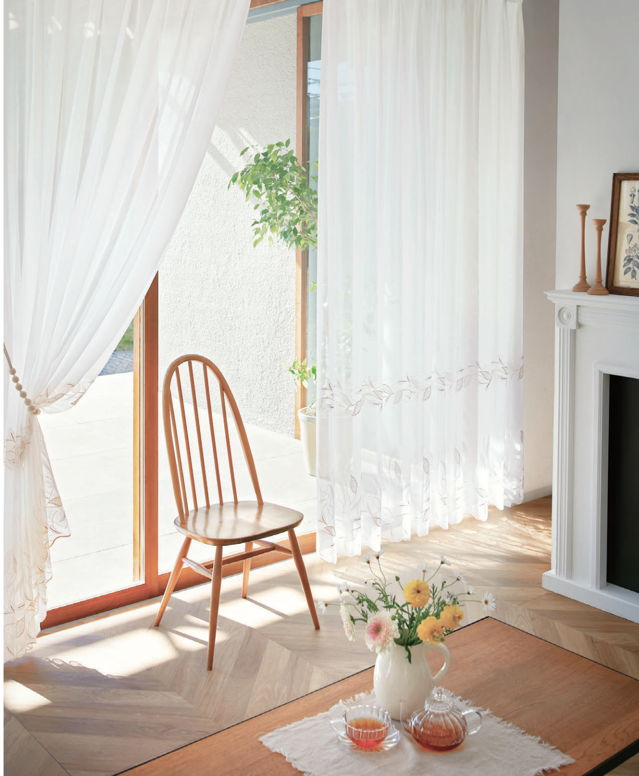
[レース] TKF30654 ソフトブリーツ [タッセル] KX51702