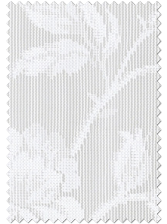
FT 6715( C ) オフシェイド クラス 3

レース | FT6715 (スタンダード) / ドレープ | FT6163 (ソフトウェーブ)