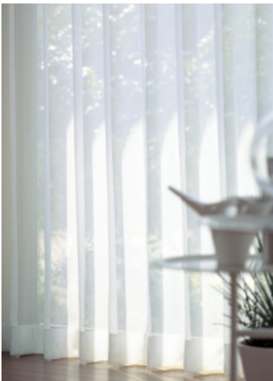
レース | FT6692 (スタンダード)

※仕上り丈261cm以上の価格は別冊価格表をご確認ください。 ※ご発注サイズ・幅サイズはレール寸法の1.05倍がお勧めです。丈サイズはカン下寸法にてご発注ください。 ※表示価格はタッセル代を含みません。タッセルをご希望の場合は500円/本にて承ります。