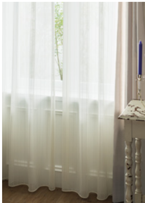
レース | FT6684 (スタンダード) / ドレープ | FT6345 (スタンダード)

※( )部分について…製作幅30cm～39cm迄の場合、丈201cm以上は製作できません。