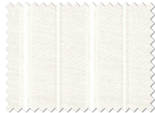
FT 6684 ( I ) オフシェイド クラス 3