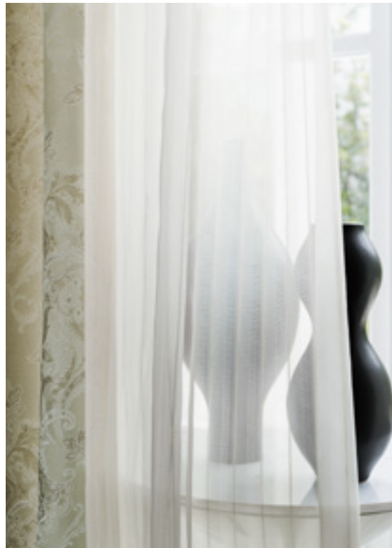
レース | FT6683 (スタンダード) / ドレープ | FT6180 (スタンダード)

※( )部分について…製作幅30cm～39cm迄の場合、丈201cm以上は製作できません。