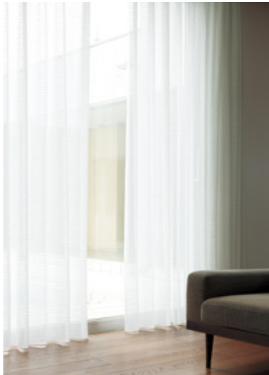
レース | FT6677 (スタンダード)

※仕上り丈261cm以上の価格は別冊価格表をご確認ください。 ※ご発注サイズ・幅サイズはレール寸法の1.05倍がお勧めです。丈サイズはカン下寸法にてご発注ください。 ※表示価格はタッセル代を含みません。タッセルをご希望の場合は500円/本にて承ります。 ※生地のみのご発注の場合は、ウェイトテープは付いていませんのでご注意ください。