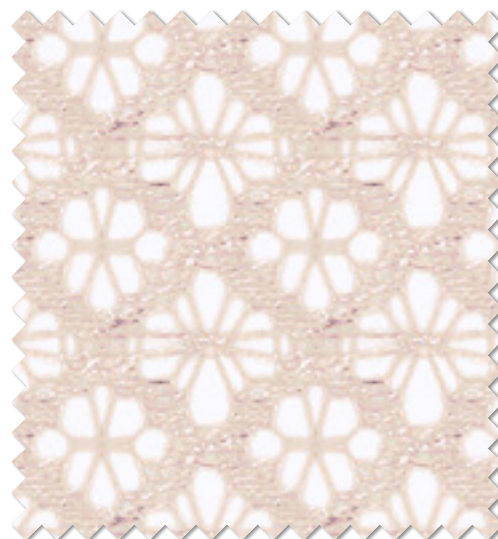
FT 6668 (P) オフシェイド クラス4