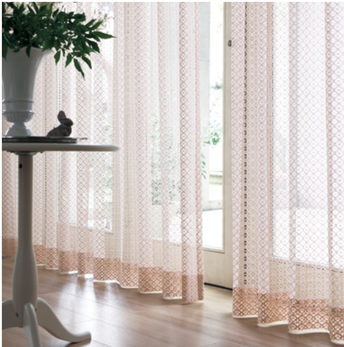
レース | FT6668 (スタンダード)