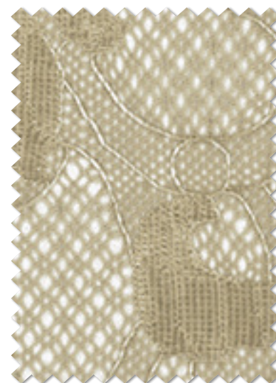
FT 6664(GR) オフシェイド クラス 3