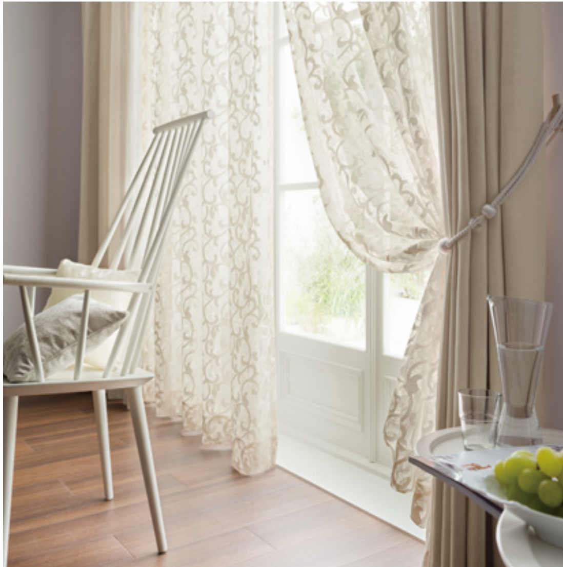
レース | FT6662 (スタンダード) /カーテン | FT6321 (スタンダード) /タッセル | KZS901 /クッション | 非売品