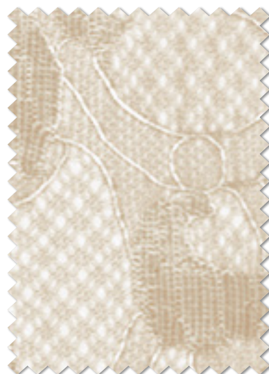
FT 6663(GO) オフシェイド クラス 3