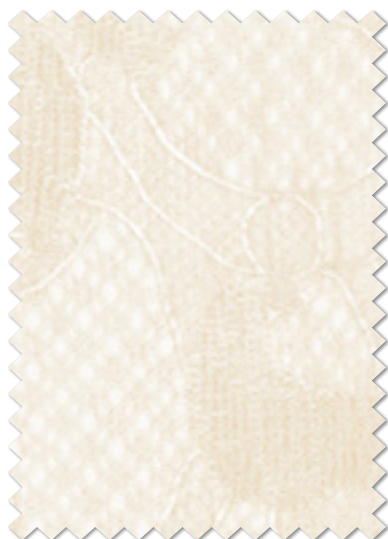
FT 6662( I ) オフシェイド クラス 3

※( )部分について…製作幅30cm～39cm迄の場合、丈201cm以上は製作できません。