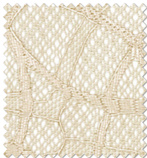
FT 6661( BE ) オフシェイド クラス4