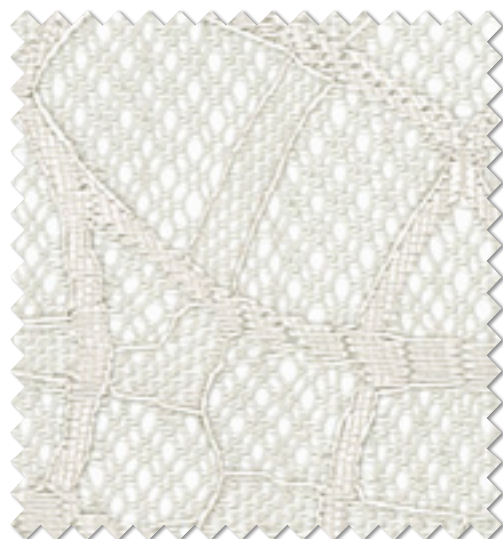
FT 6660( I ) オフシェイド クラス4

※( )部分について…製作幅30cm～39cm迄の場合、丈201cm以上は製作できません。