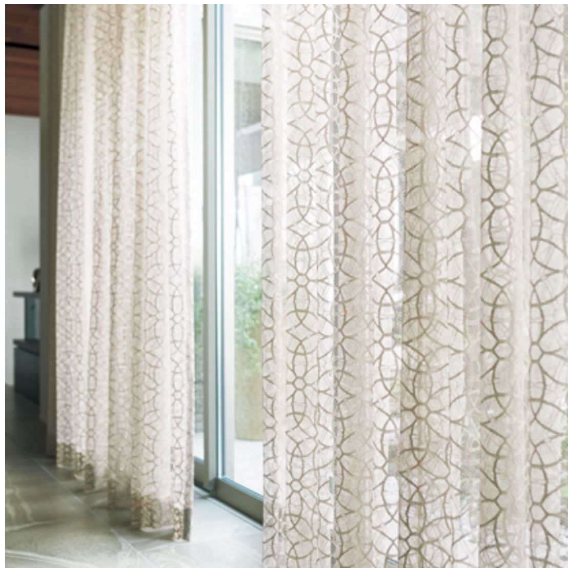
レース | FT6661 (スタンダード)