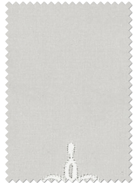
FT 6657( I ) オフシェイド クラス 3

レース | FT6657 (スタンダード) / タッセル | KZS892 / クッション | 非売品