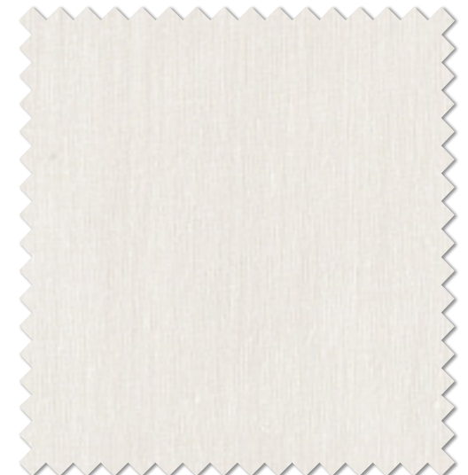
FT 6640 ( I ) オフシェイド クラス 2