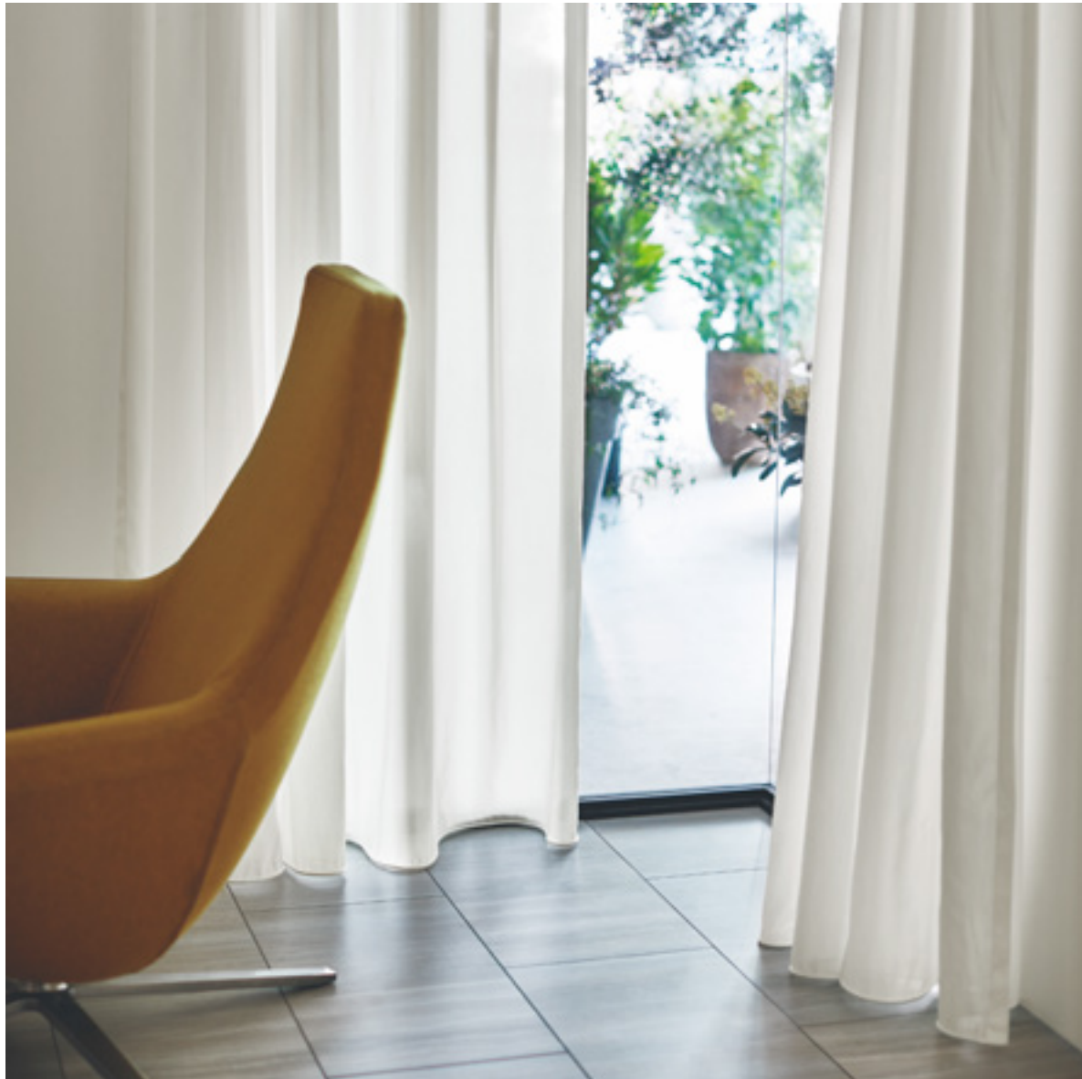
レース | FT6639 (スタンダード)