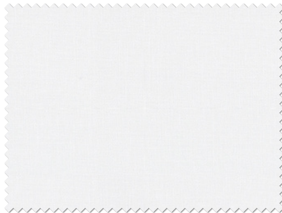
FT 6637( C )