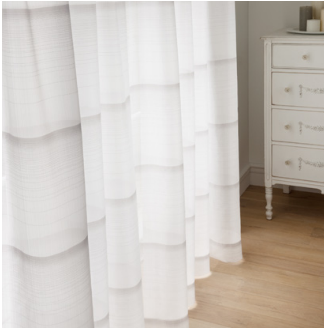
レース | FT6633 (スタンダード)