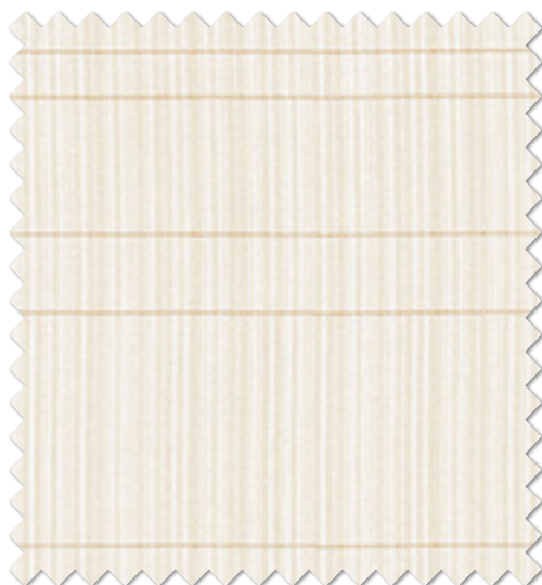
FT 6632(O) オフシェイド クラス3

※( )部分について…製作幅30cm～39cm迄の場合、丈201cm以上は製作できません。