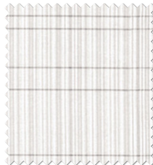
FT 6633(GR) オフシェイド クラス3