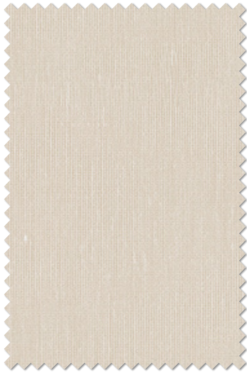
FT 6618(BE) オフシェイド クラス1