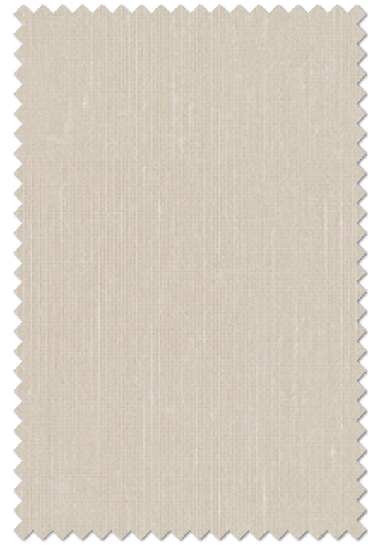
FT 6620(GR) オフシェイド クラス1