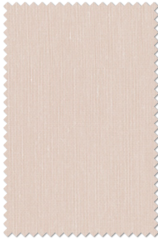
FT 6619(P) オフシェイド クラス1