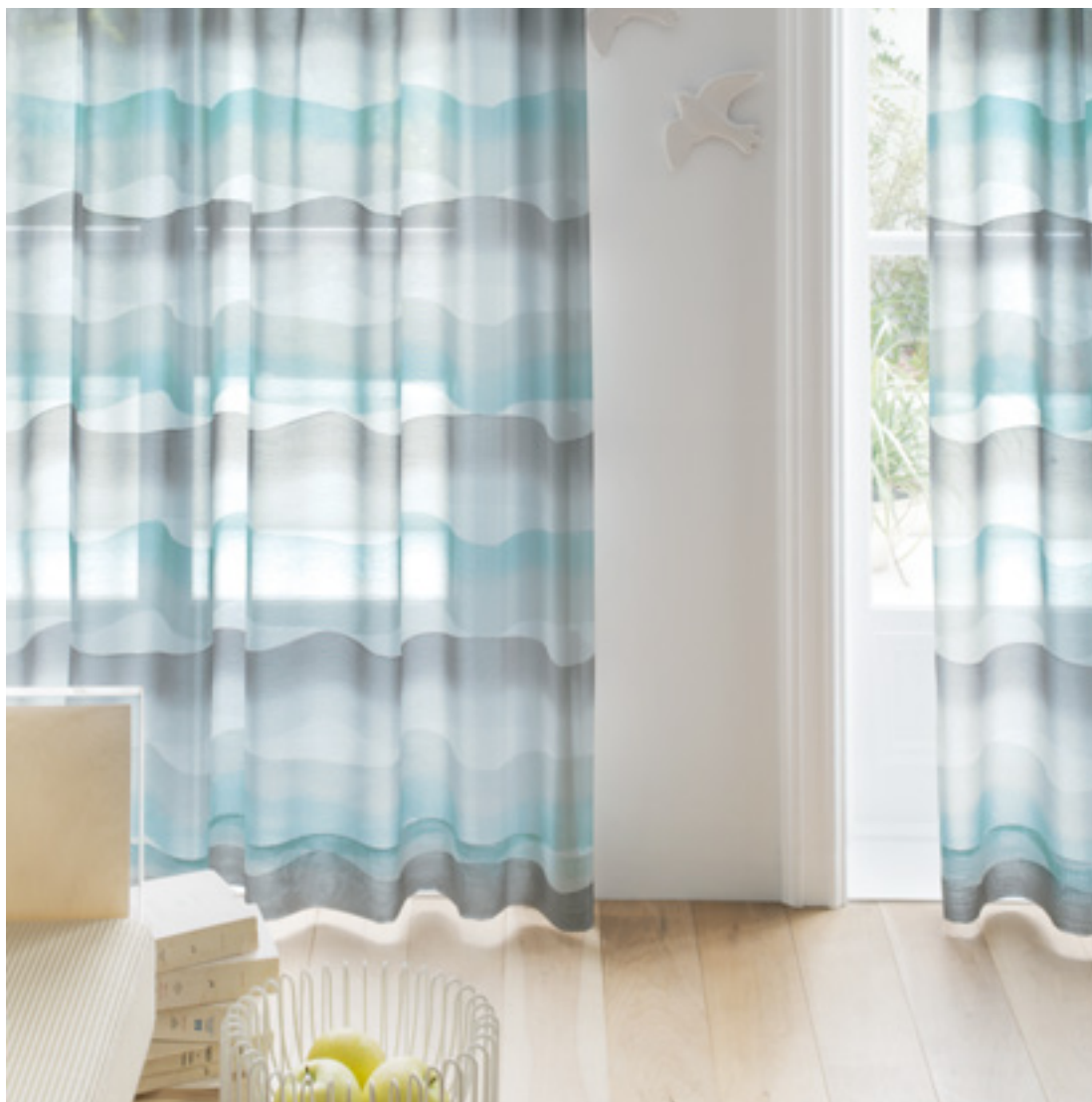
レース | FT6614 (スタンダード)