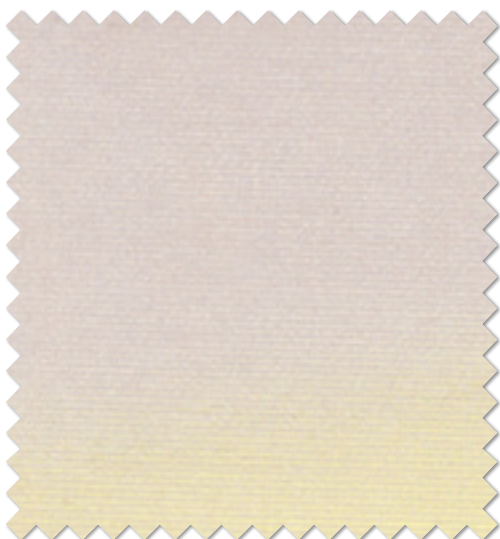
FT 6613( Y ) オフシェイド クラス3

※( )部分について…製作幅30cm～39cm迄の場合、丈201cm以上は製作できません。