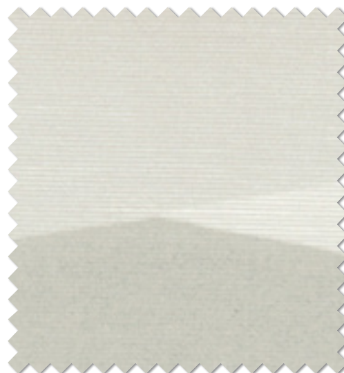
FT 6614( B ) オフシェイド クラス3