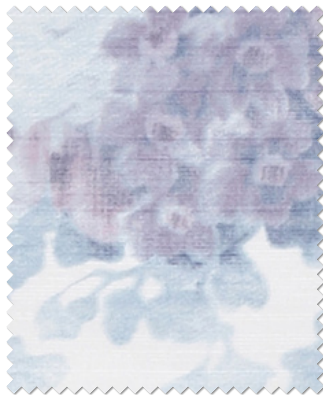
FT 6608( B )