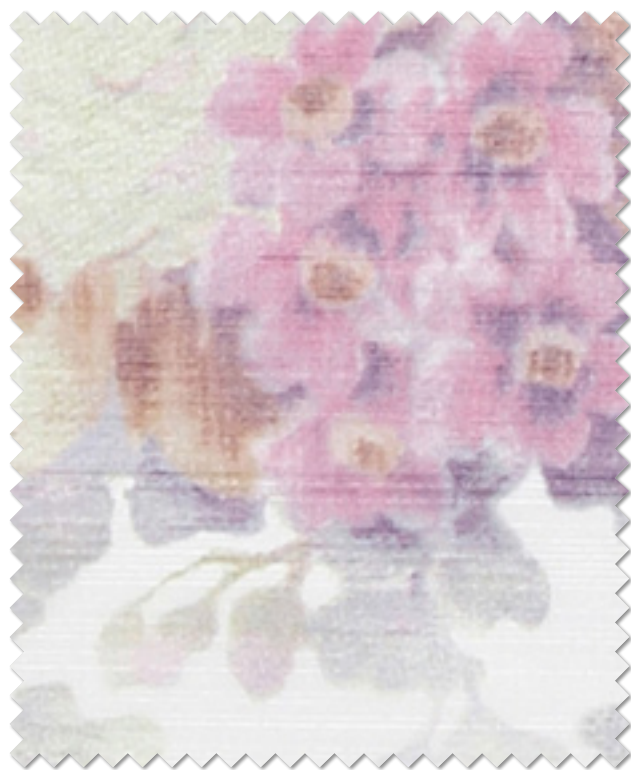
FT 6607( P )