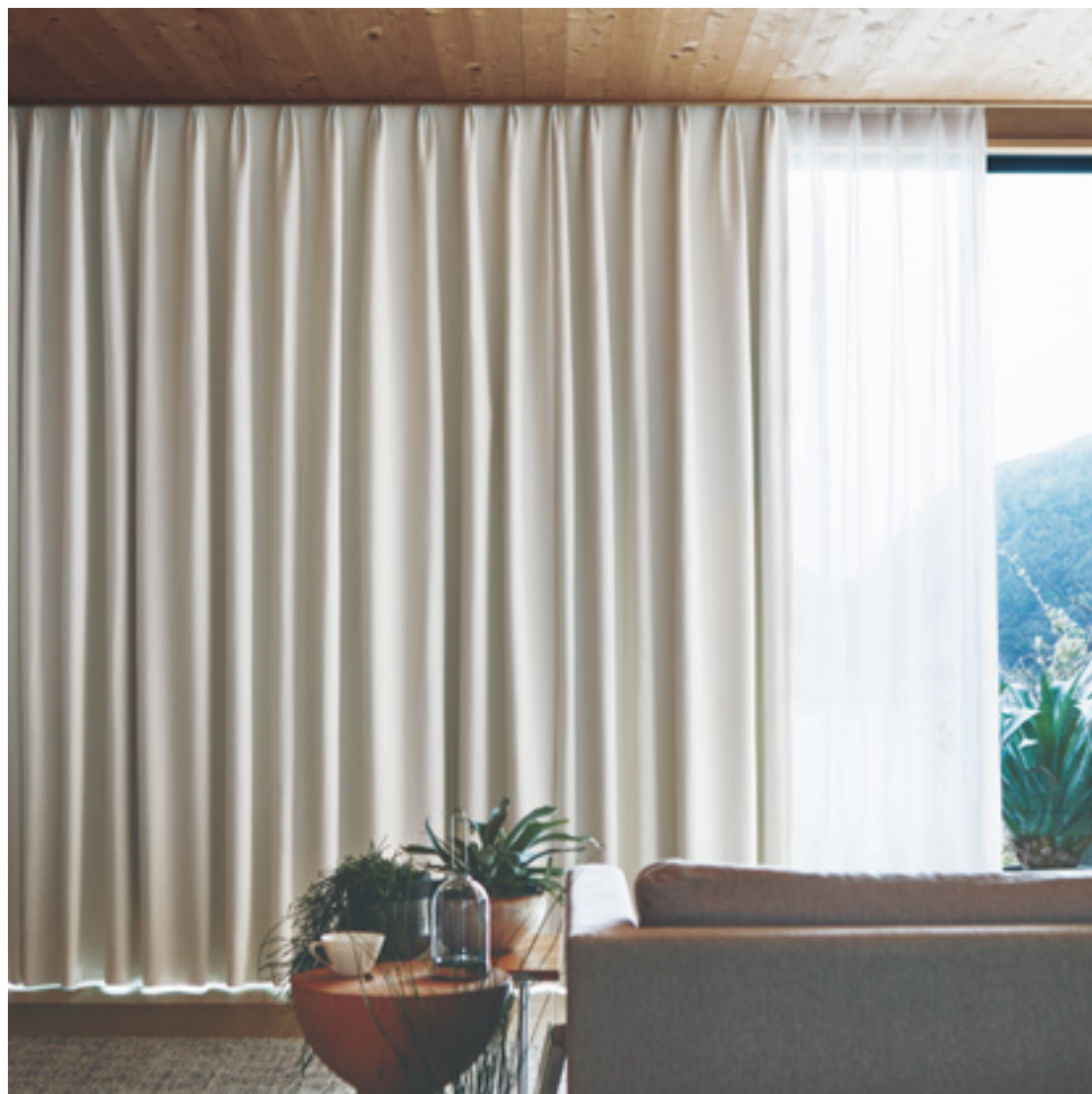
ドレープ | FT6576 (ソフトウェーブ) / レース | FT6697 (スタンダード)