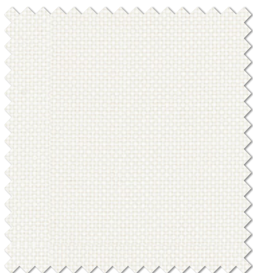
FT 6576 ( W )

※( )部分について・製作幅30cm~39cm迄の場合、丈201cm以上は製作できません。