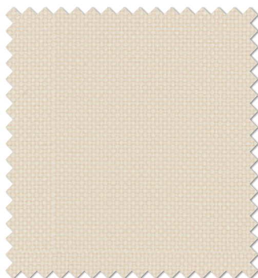
FT 6577 ( BE )