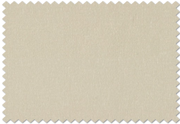
FT 6539 (BE)