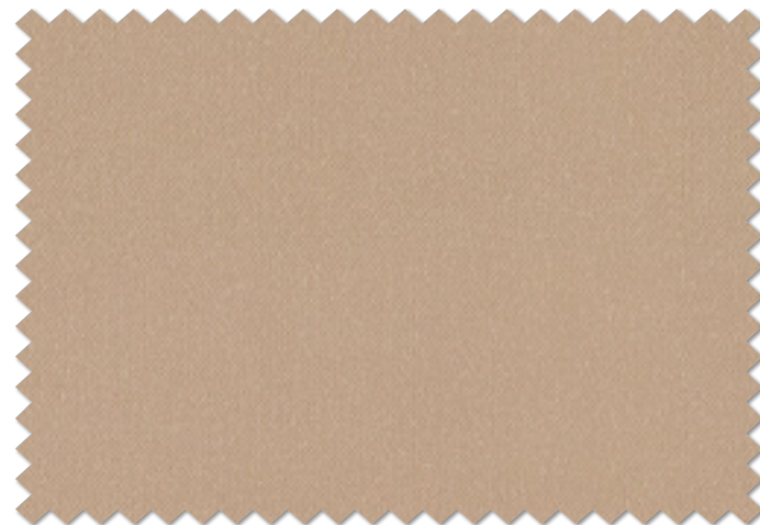
FT 6542 ( P )