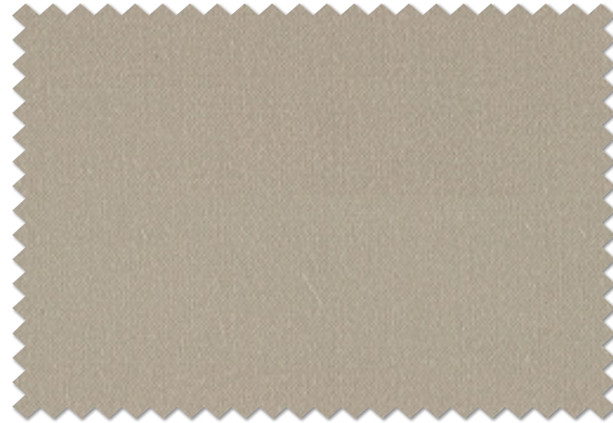
FT 6540 (GR)