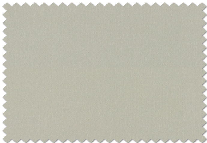
FT 6541 (BGR)