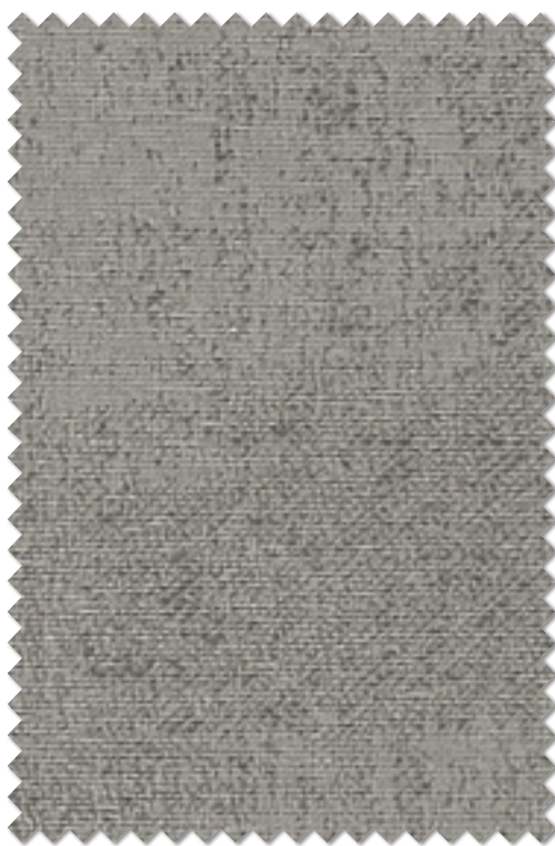
FT 6510(LGR) 遮光 2 級