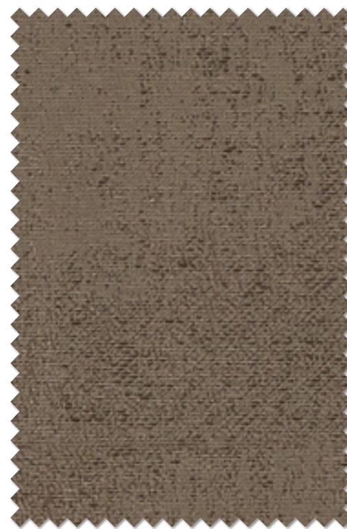
FT 6511 (BR) 遮光 2 級