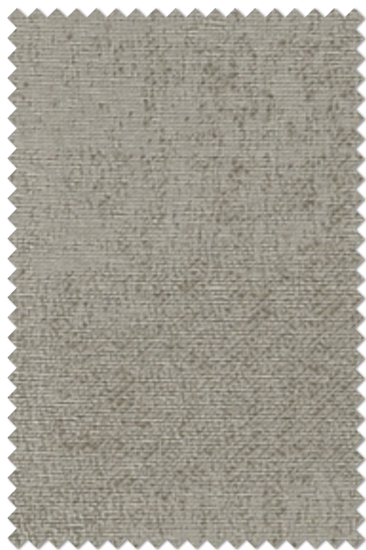
FT 6509( I ) 遮光 2 級