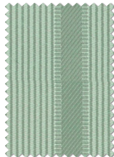
FT 6502 ( G ) 遮光 2 級