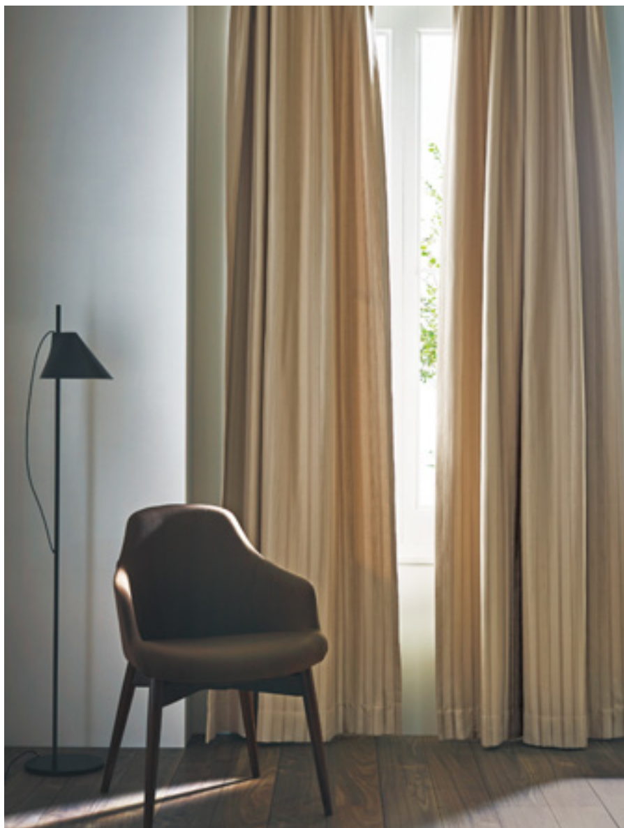
ドレープ | FT6499 (スタンダード)