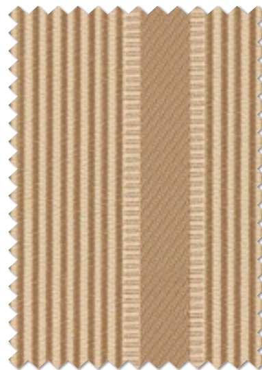
FT 6499 ( BE ) 遮光 2 級