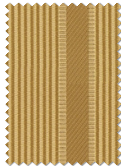
FT 6500 ( O ) 遮光 2 級