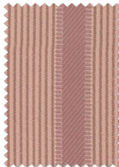
FT 6501 ( P ) 遮光 2 級