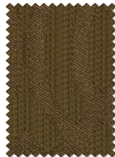
FT 6498 (BR) 遮光 2 級

ドレープ | FT6498 (スタンダード) / レース | FT6701 (スタンダード) / タッセル | KZS894 / クッション | FT6365 (パイピング) / クッション | FT6382 (プレーン)