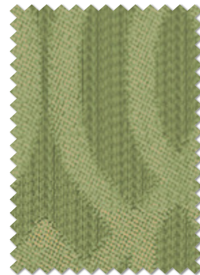
FT 6496 (G) 遮光 2 級