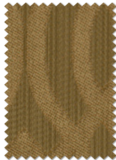
FT 6495 (BE) 遮光 2 級