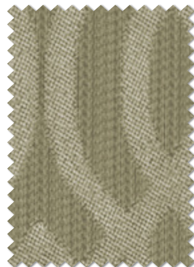
FT 6497 (GR) 遮光 2 級