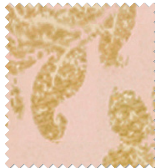
FT 6494 (P)