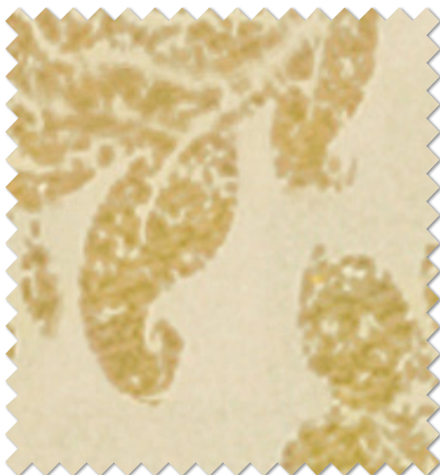
FT 6493 (BE)

※( )部分について…製作幅30cm～39cm迄の場合、丈201cm以上は製作できません。