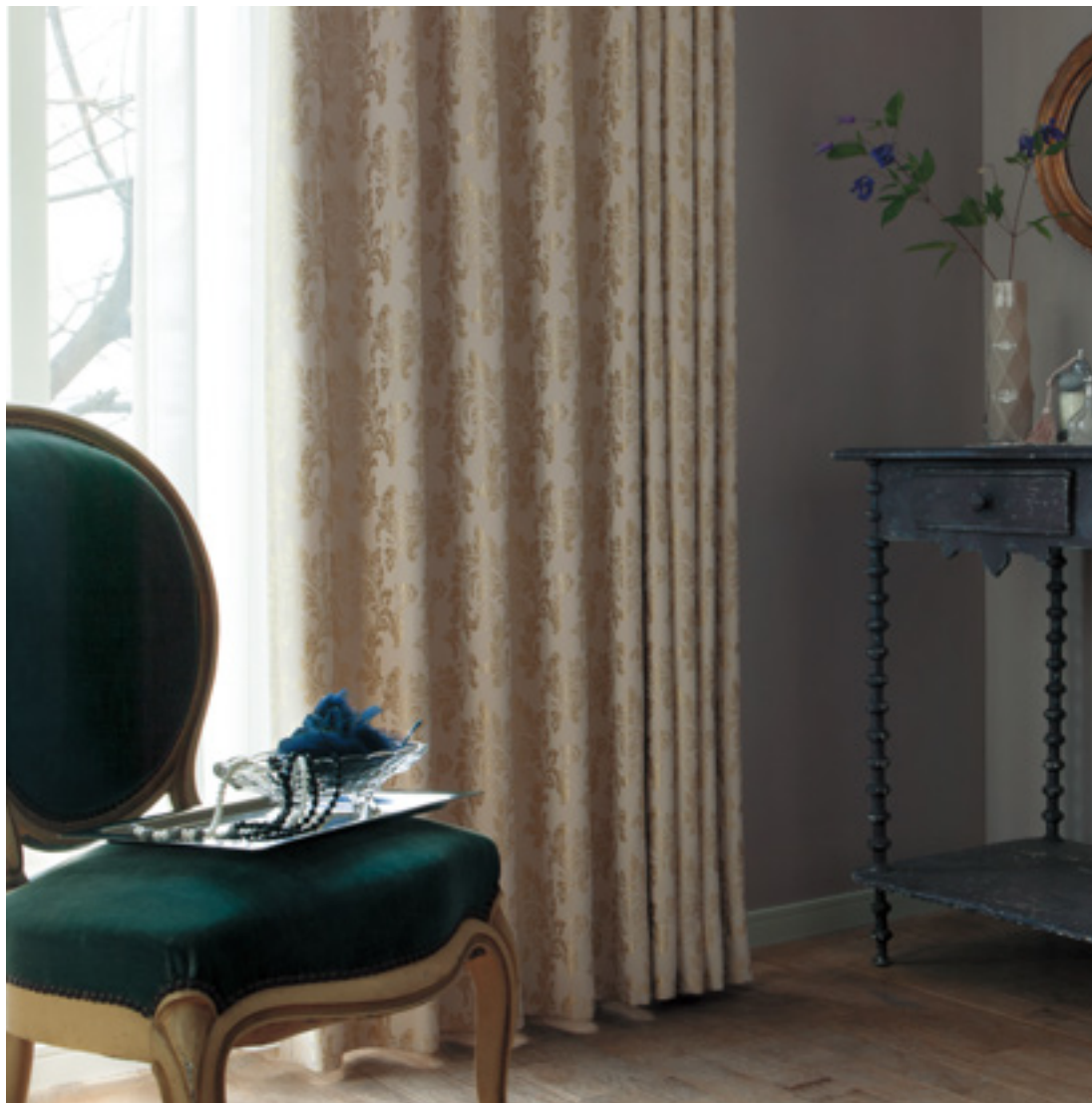
ドレープ | FT6493 (ソフトウェーブ) / レース | FT6694 (スタンダード)