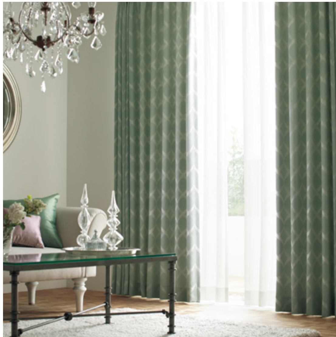
ドレープ | FT6491 (ソフトウェーブ) / レース | FT6717 (スタンダード)