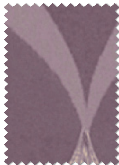
FT 6492 ( V )