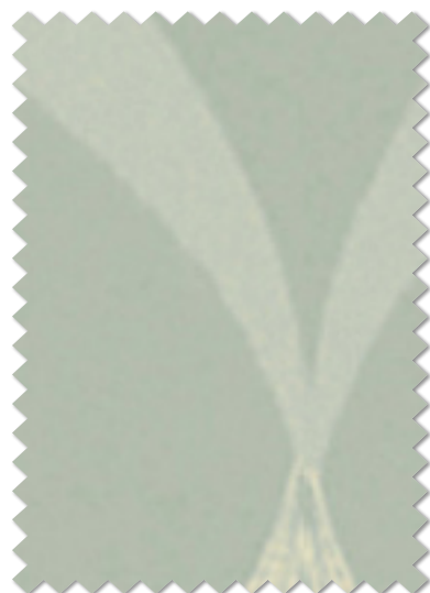
FT 6491 ( B )