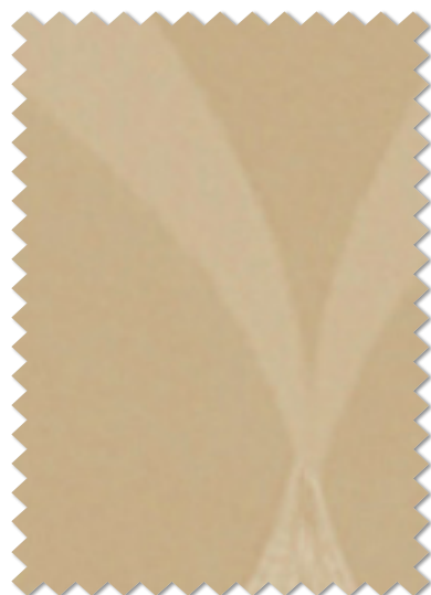
FT 6490 (BE)

※( )部分について…製作幅30cm～39cm迄の場合、丈201cm以上は製作できません。