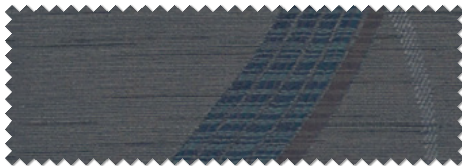
FT 6473 ( B )