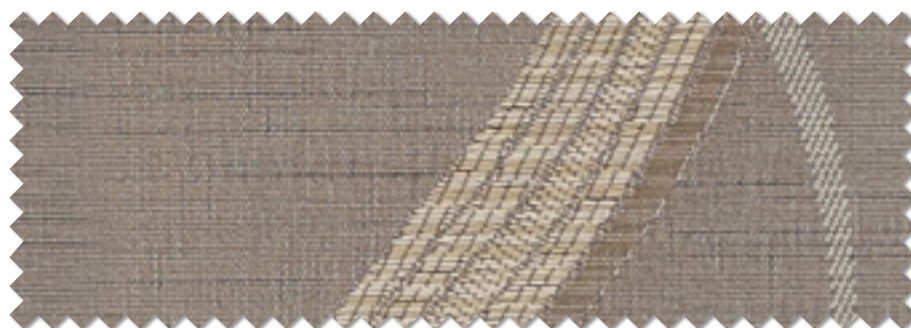
FT 6471 (LBR)