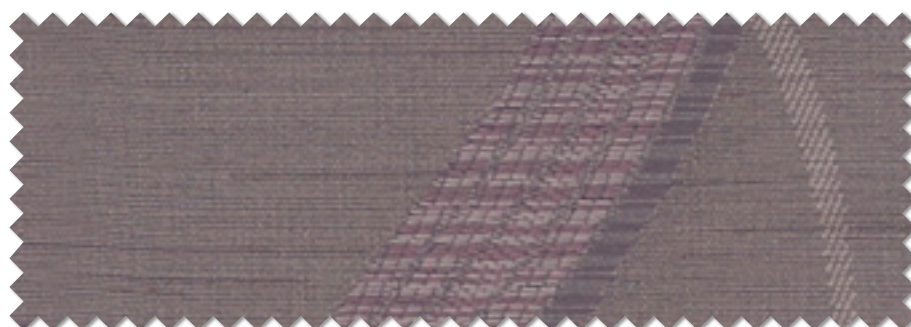
FT 6472 (LV)