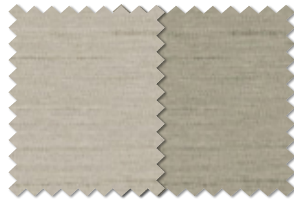
FT 6430(LGR) FT 6431(LGR)