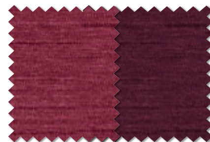
FT 6456(RO) FT 6457(RO)