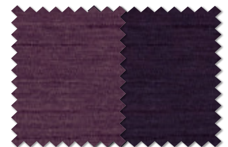
FT 6458(V) FT 6459(V)