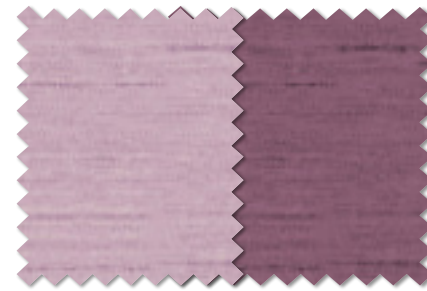
FT 6432(LV) FT 6433(LV)