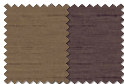
FT 6446(LBR) FT 6447(LBR)