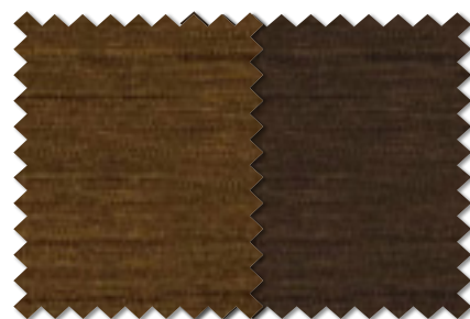
FT 6454(BR) FT 6455(BR)