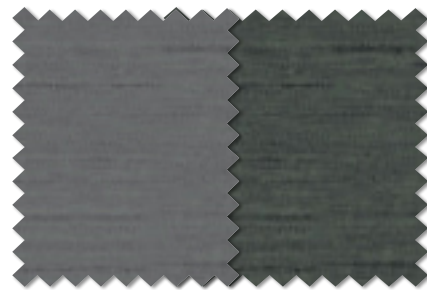
FT 6438(GR) FT 6439(GR)