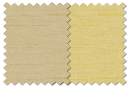
FT 6436(LY) FT 6437(LY)