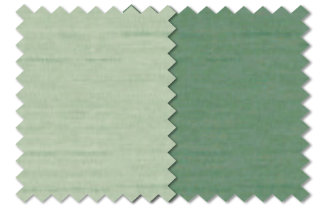
FT 6434(LB) FT 6435(LB)