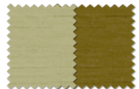
FT 6450(G) FT 6451(G)