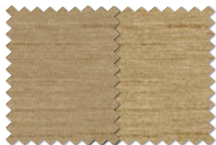
FT 6452(DBE) FT 6453(DBE)