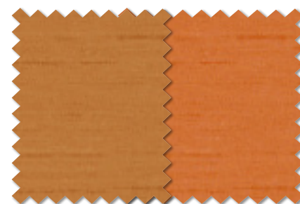
FT 6448(O) FT 6449(O)