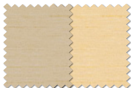
FT 6444(BE) FT 6445(BE)