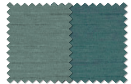
FT 6442(B) FT 6443(B)