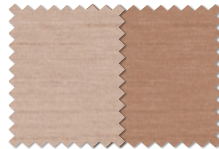
FT 6440(LP) FT 6441(LP)