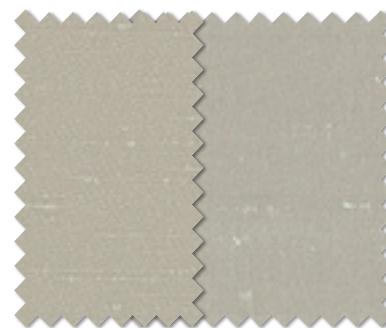
FT 6417(GR1) FT 6418(GR1)