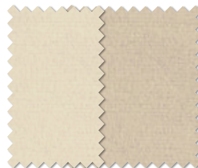
FT 6413( I ) FT 6414( I )