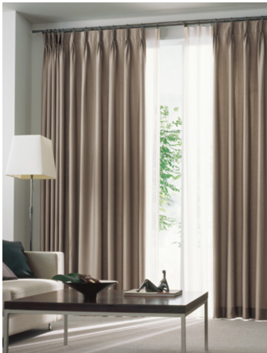
ドレープ | FT6415 (ソフトウェーブ) / レース | FT6686 (スタンダード)