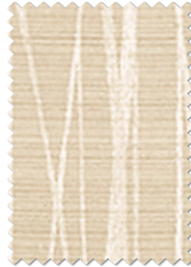
FT 6316( I )