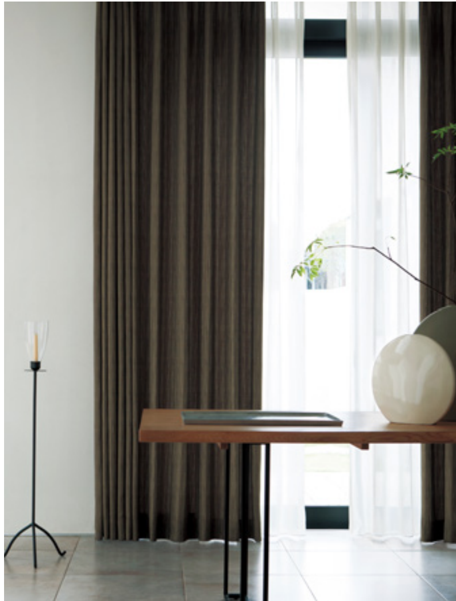
ドレープ | FT6319 (ソフトウェーブ) / レース | FT6701 (スタンダード)