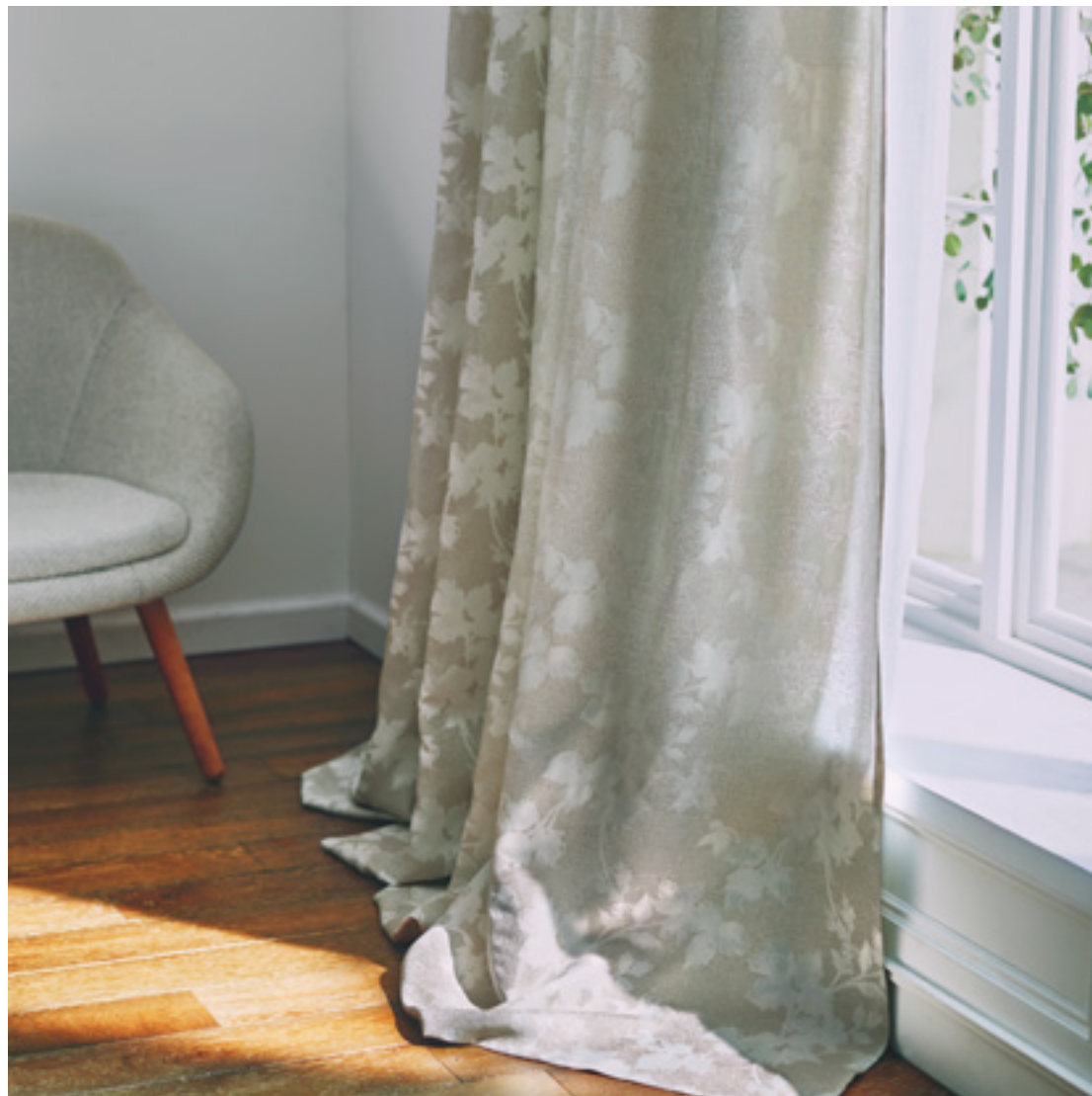
ドレープ | FT6311 (スタンダード) / レース | FT6601 (スタンダード)