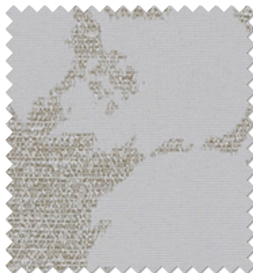
FT 6312 (GR)