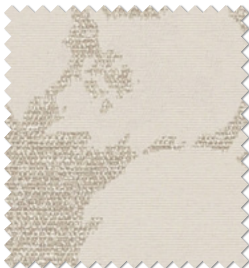
FT 6311 (BE)

※( )部分について…製作幅30cm～39cm迄の場合、丈201cm以上は製作できません。