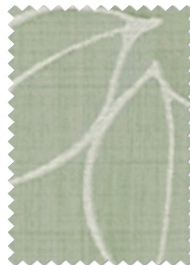
FT 6310 (BG)