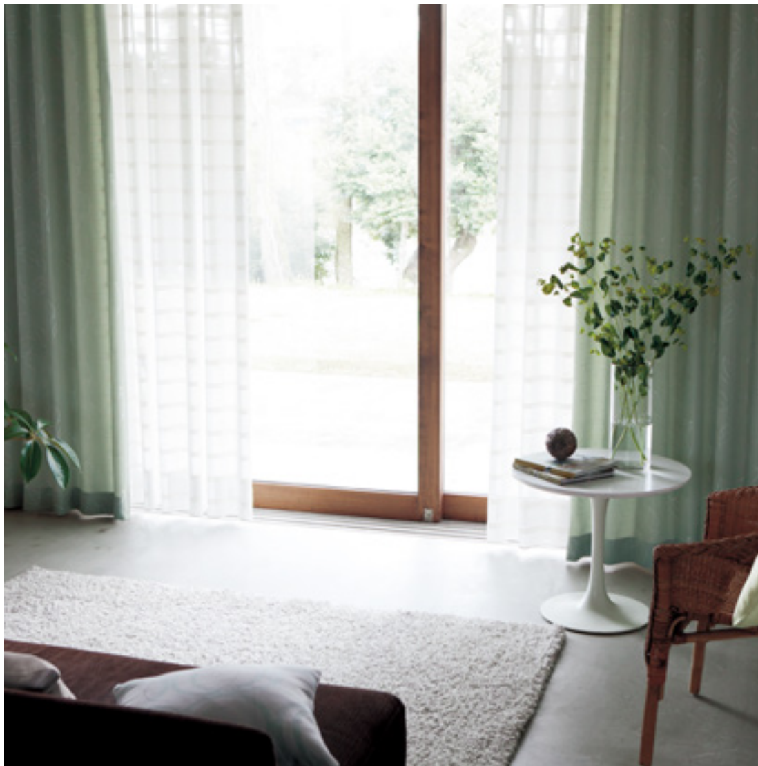
ドレープ | FT6310 (ソフトウェーブ) / レース | 非売品 / クッション | FT6291 FT6428 (プレーン)