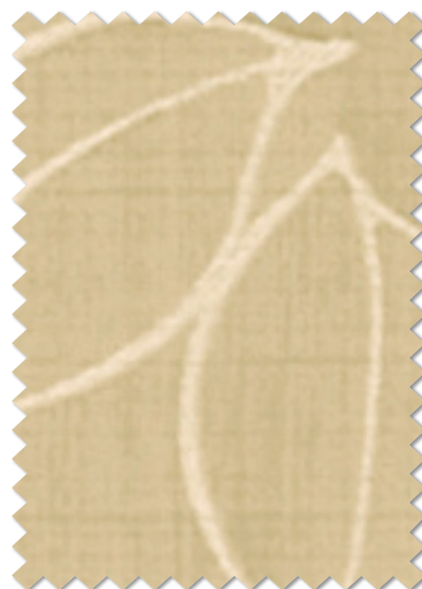
FT 6309 ( Y )