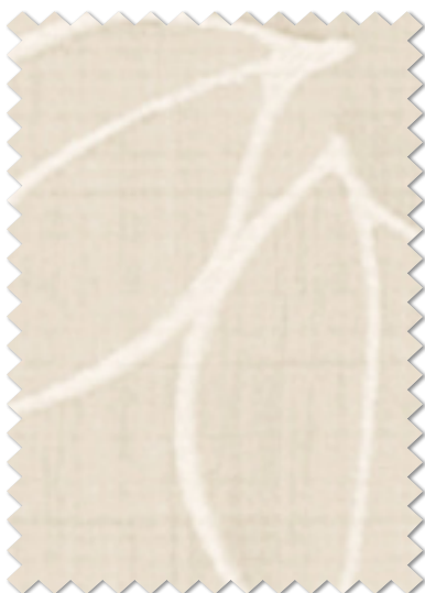
FT 6308 ( I )

※( )部分について…製作幅30cm~39cm迄の場合、丈201cm以上は製作できません。