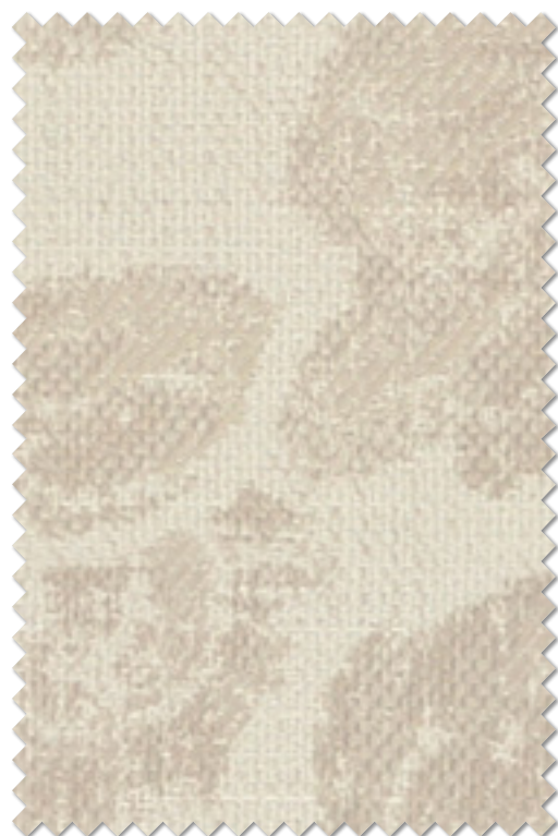
FT 6298( BE )