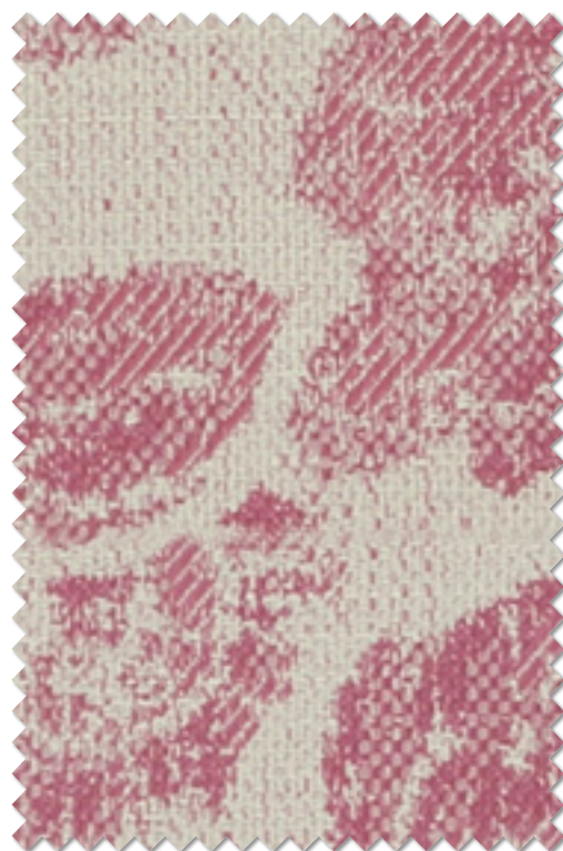
FT 6299( P )