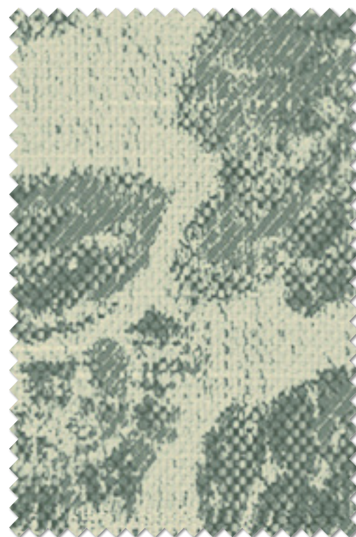
FT 6300( B )